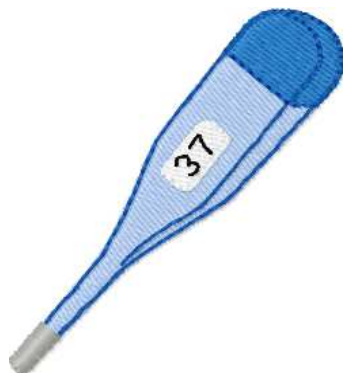
Name: Thermometer.EMB Datei: THERMOMETER.TBF Stiche: 2946 Größe: 54.8x60.4 mm