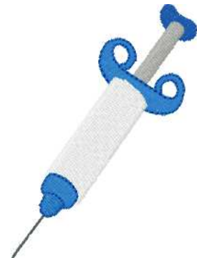
Name: Spritze.EMB Datei: SPRITZE.TBF Stiche: 4014 Größe: 62.6x85.0 mm