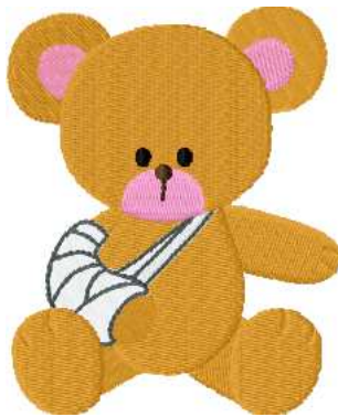
Name: Baer Gips.EMB Datei: BAER GIPS.TBF Stiche: 13405 Größe: 79.0x96.4 mm