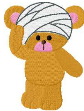
Name: Baer Verband.EMB Datei: BAER VERBAND.TBF Stiche: 11698 Größe: 72.8x96.4 mm