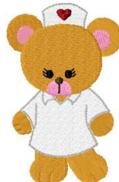
Name: Krankenschwester Datei: KRANKENSCHWESTER.TBF Stiche: 10201 Größe: 61.8x96.4 mm