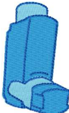
Name: Inhalator.EMB Datei: INHALATOR.TBF Stiche: 4503 Größe: 36.8x60.6 mm