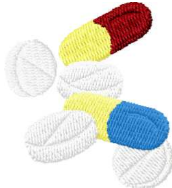
Name: Medikamente.EMB Datei: MEDIKAMENTE.TBF Stiche: 3606 Größe: 45.2x50.2 mm