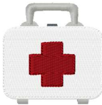
Name: Arztkoffer.EMB Datei: ARZTKOFFER.TBF Stiche: 5296 Größe: 50.4x52.6 mm