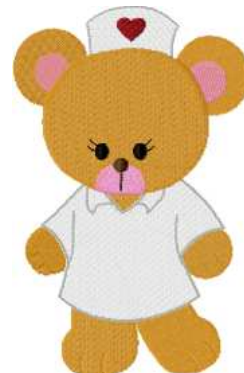
Name: Krankenschwester Datei: KRANKENSCHWESTER.TBF Stiche: 28106 Größe: 113.0x176.4 mm