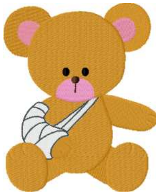
Name: Baer Gips.EMB Datei: BAER GIPS.TBF Stiche: 29520 Größe: 126.4x154.4 mm