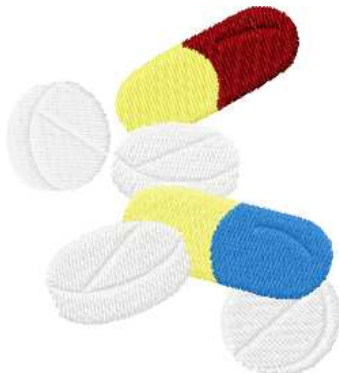
Name: Medikamente.EMB Datei: MEDIKAMENTE.TBF Stiche: 7439 Größe: 72.4x80.4 mm