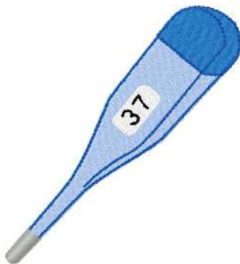
Name: Thermometer.EMB Datei: THERMOMETER.TBF Stiche: 5909 Größe: 87.4x96.6 mm