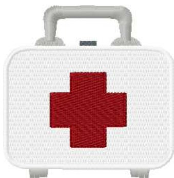
Name: Arztkoffer.EMB Datei: ARZTKOFFER.TBF Stiche: 12127 Größe: 82.4x83.8 mm