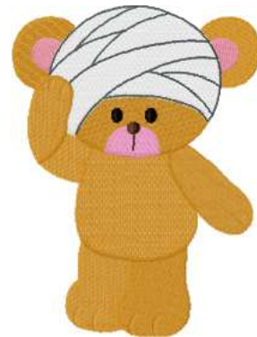
Name: Baer Verband.EMB Datei: BAER VERBAND.TBF Stiche: 29678 Größe: 126.8x167.8 mm