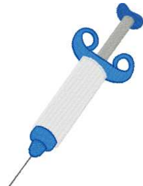
Name: Spritze.EMB Datei: SPRITZE.TBF Stiche: 7814 Größe: 100.0x135.8 mm