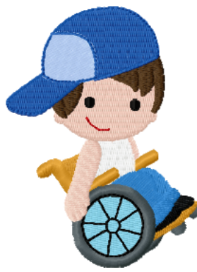
Name: Kind 2.EMB Datei: KIND 2.TBF Stiche: 11771 Größe: 72.2x97.0 mm