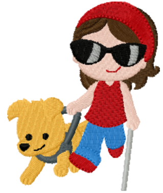
Name: Kind 6.EMB Datei: KIND 6.TBF Stiche: 13669 Größe: 78.0x96.6 mm