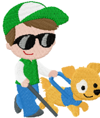
Name: Kind 5.EMB Datei: KIND 5.TBF Stiche: 14677 Größe: 82.8x96.8 mm