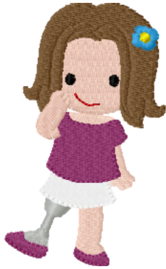
Name: Kind 4.EMB Datei: KIND 4.TBF Stiche: 8855 Größe: 58.6x96.4 mm