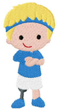
Name: Kind 3.EMB Datei: KIND 3.TBF Stiche: 8849 Größe: 46.2x95.4 mm