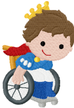
Name: Kind 8.EMB Datei: KIND 8.TBF Stiche: 12713 Größe: 66.4x96.2 mm