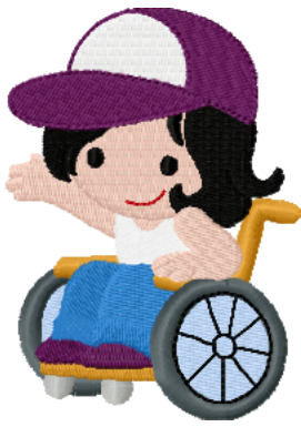
Name: Kind 1.EMB Datei: KIND 1.TBF Stiche: 14533 Größe: 69.6x96.6 mm