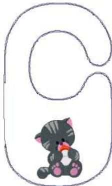
Name: Katze 1.EMB Datei: KATZE 1.TBF Stiche: 16507 Größe: 177.0x297.0 mm Farben: 11/16 Stops: 15