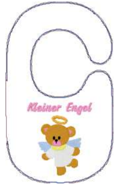
Name: Engel.EMB Datei: ENGEL.TBF Stiche: 16724 Größe: 177.0x297.0 mm Farben: 11/15 Stops: 14