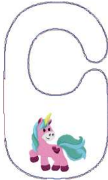
Name: Einhorn.EMB Datei: EINHORN.TBF Stiche: 18294 Größe: 177.0x297.0 mm Farben: 11/21 Stops: 20