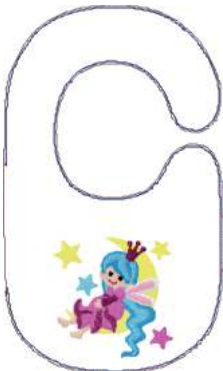
Name: Fee.EMB Datei: FEE.TBF Stiche: 17794 Größe: 177.0x297.0 mm Farben: 14/19 Stops: 18