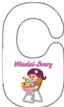
Name: Zwerg 1.EMB Datei: ZWERG 1.TBF Stiche: 17932 Größe: 177.0x297.0 mm Farben: 15/29 Stops: 28