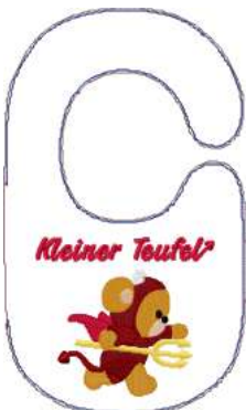
Name: Teufel.EMB Datei: TEUFEL.TBF Stiche: 19037 Größe: 177.0x297.0 mm Farben: 11/16 Stops: 15