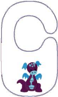
Name: Drache.EMB Datei: DRACHE.TBF Stiche: 15999 Größe: 177.0x297.0 mm Farben: 8/11 Stops: 10