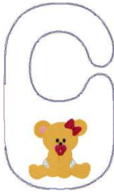
Name: Baer 2.EMB Datei: BAER 2.TBF Stiche: 18846 Größe: 177.0x297.0 mm Farben: 10/13 Stops: 12