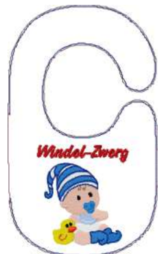
Name: Zwerg 2.EMB Datei: ZWERG 2.TBF Stiche: 21910 Größe: 177.0x297.0 mm Farben: 12/21 Stops: 20