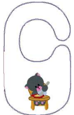
Name: Katze 2.EMB Datei: KATZE 2.TBF Stiche: 15376 Größe: 177.0x297.0 mm Farben: 13/21 Stops: 20