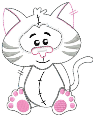
Name: Katze 10x10.EMB Datei: KATZE 10X10.TBF Stiche: 6346 Größe: 79.2x97.0 mm Farben: 8/32 Stops: 31