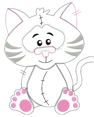
Name: Katze 16x26.EMB Datei: KATZE 16X26.TBF Stiche: 12255 Größe: 157.0x192.4 mm Farben: 8/32 Stops: 31