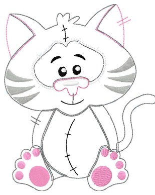
Name: Katze 13x18.EMB Datei: KATZE 13X18.TBF Stiche: 9842 Größe: 127.0x155.6 mm Farben: 8/32 Stops: 31