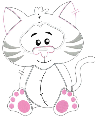
Name: Katze 20x30.EMB Datei: KATZE 20X30.TBF Stiche: 15810 Größe: 197.0x241.4 mm Farben: 8/32 Stops: 31